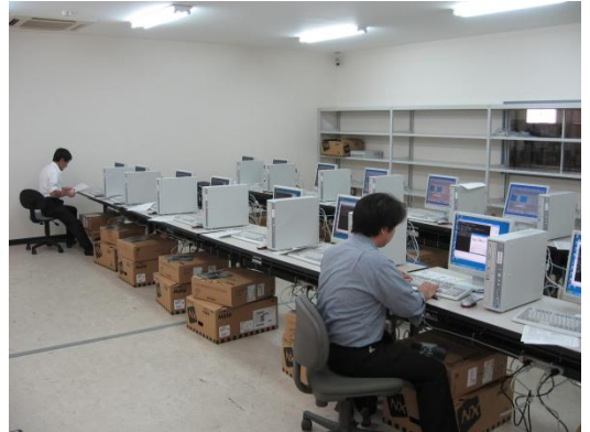
●参考写真:キitting作業ルーム(30坪)